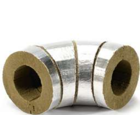
Отвод ХОТPIPE L Alu