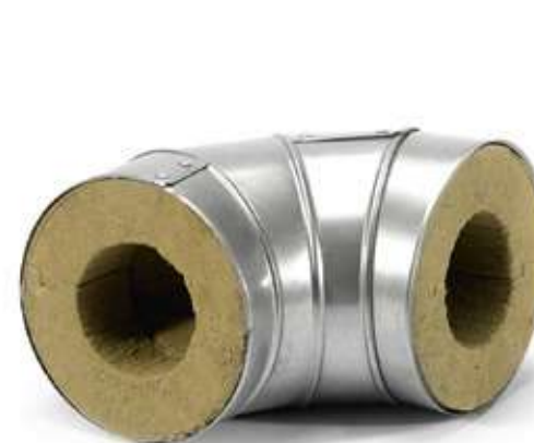
Отвод XOTPIPE L ME