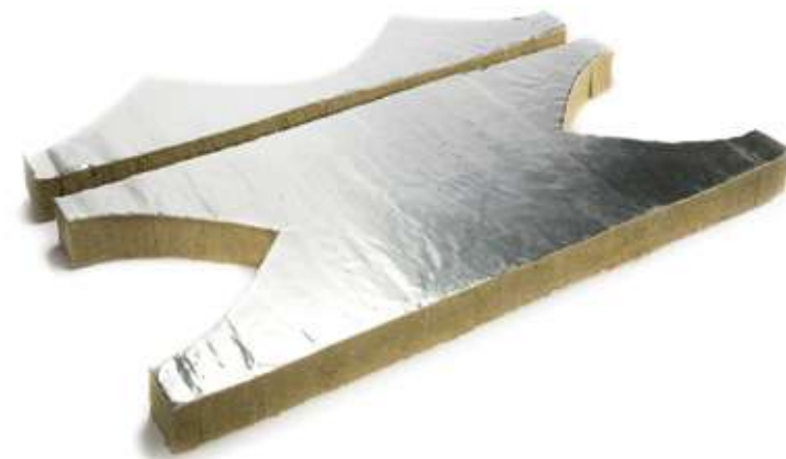
Тройник ХОТПАЙП ПР-СТ в развернутом виде