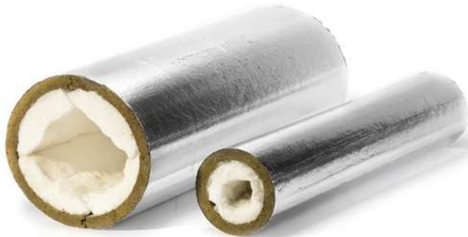
ХОТPIPE SP Combi Alu кашированные фольгой