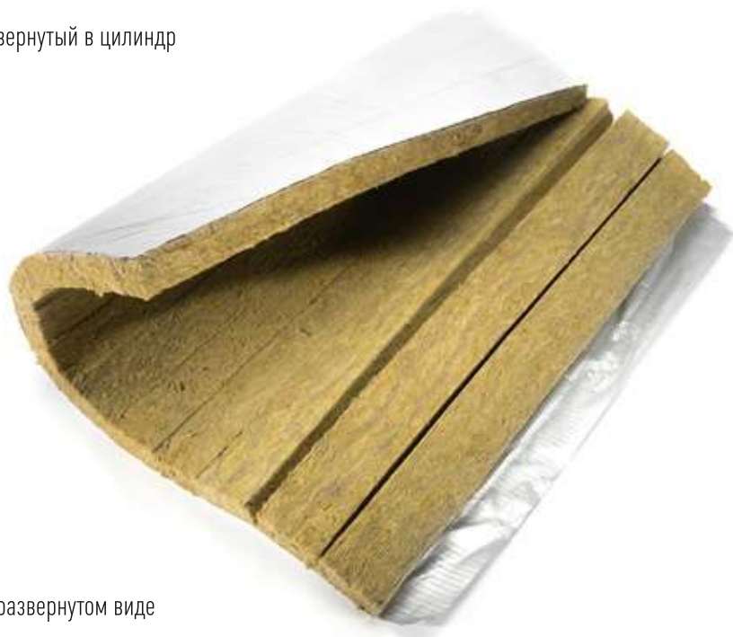
HOTPIPE SP-LM Alu 50 в развернутом виде