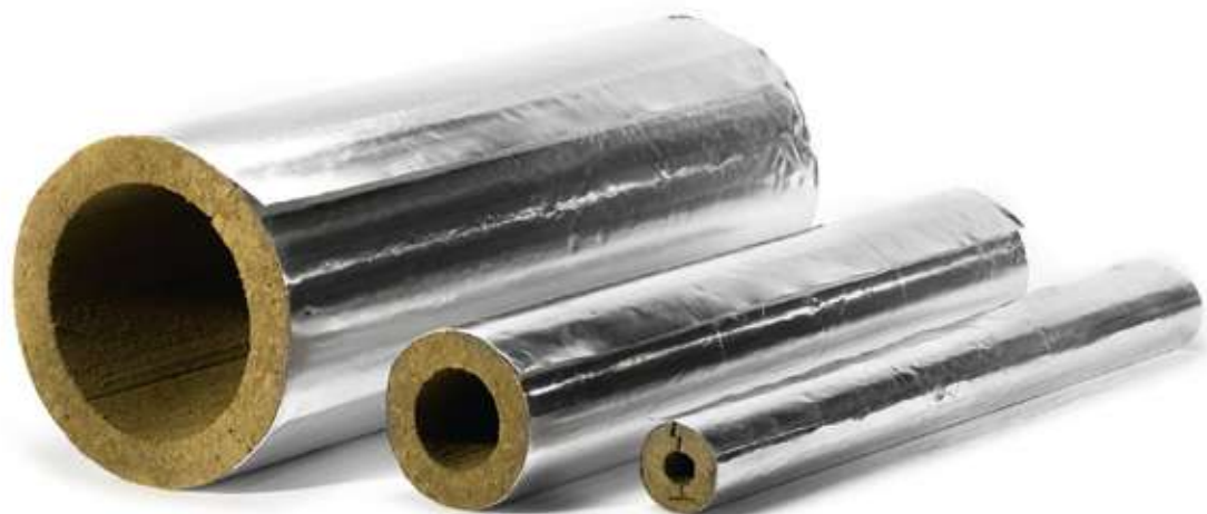
Прямые участки HOTPIPE SP Outside