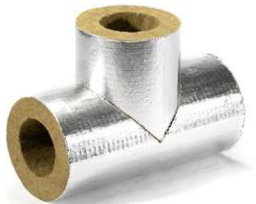
Тройник ХОТPIPE T Alu