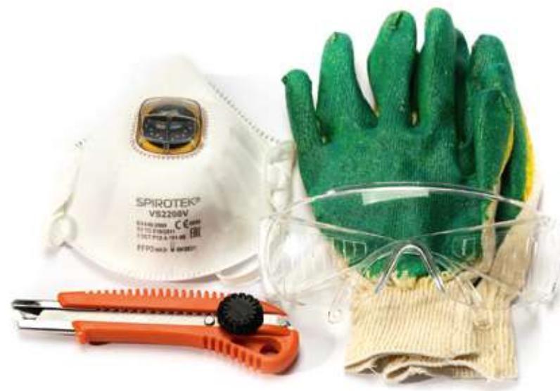
Набор заботы о монтажнике HOTPIPE Care Plus