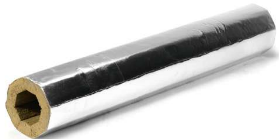
ХОТPIPE FP Outside 80 с защитным покрытием, свернутый в цилиндр