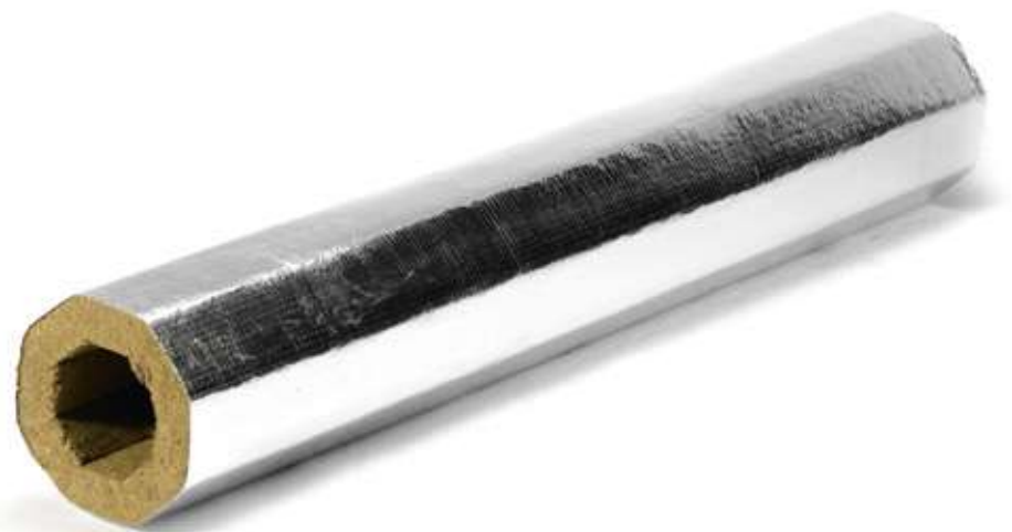
ХОТPIPE FP Alu 80 кашированный фольгой, свернутый в цилиндр