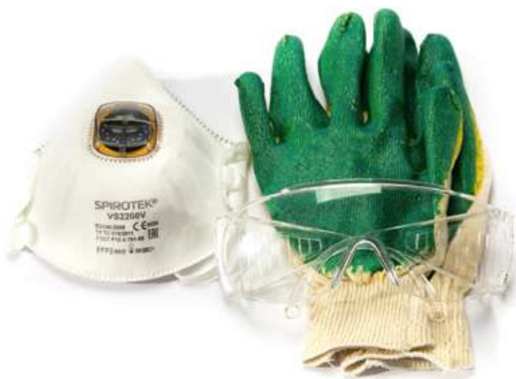
Набор заботы о монтажнике HOTPIPE Care