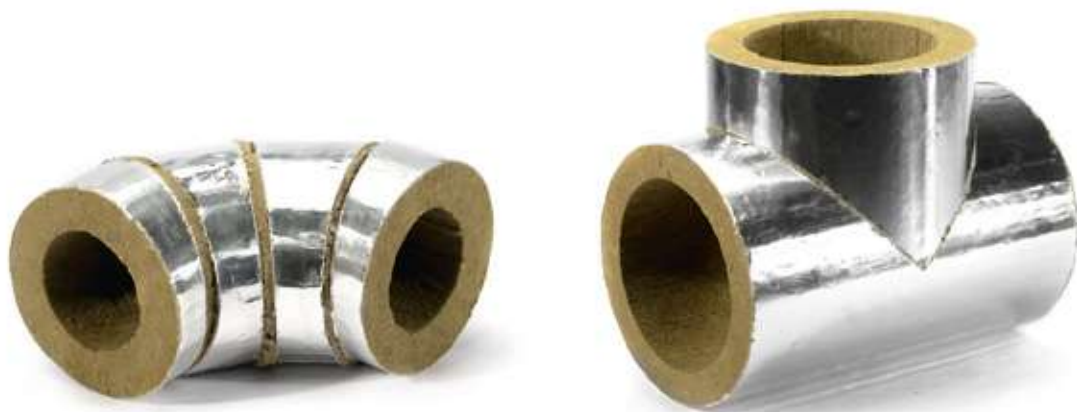
Отвод HOTPIPE L Outside