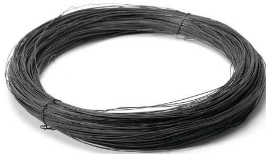
Проволока вязальная 1,2 мм