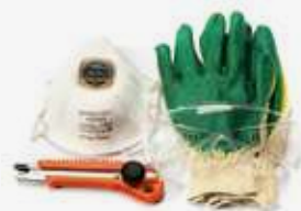
Набор заботы о монтажнике HOTPIPE Care Plus