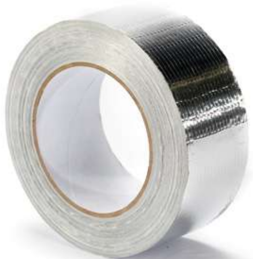
Скотч алюминиевый армированный 50x50