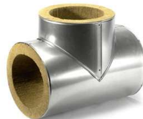
Тройник XOTPIPE T ME