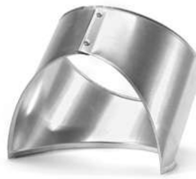
Врезка ХОТPIPE O-ME V