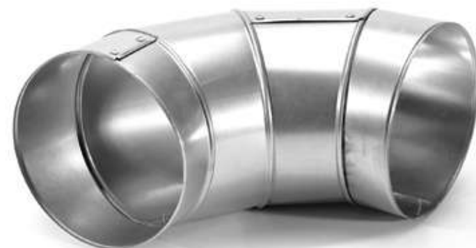
Отвод ХОТPIPE O-ME L