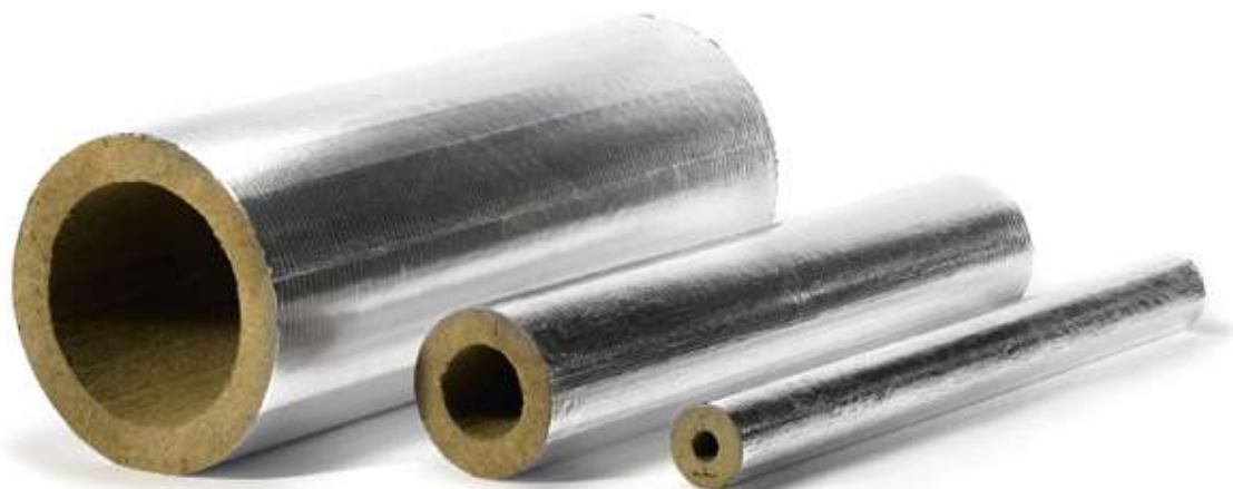
Прямые участки ХОТPIPE SP Alu