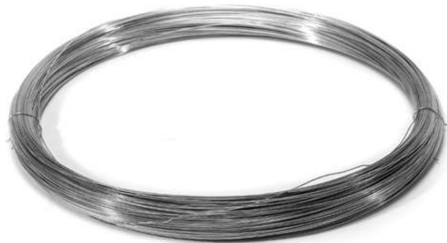
Проволока вязальная оцинкованная 1,2 мм