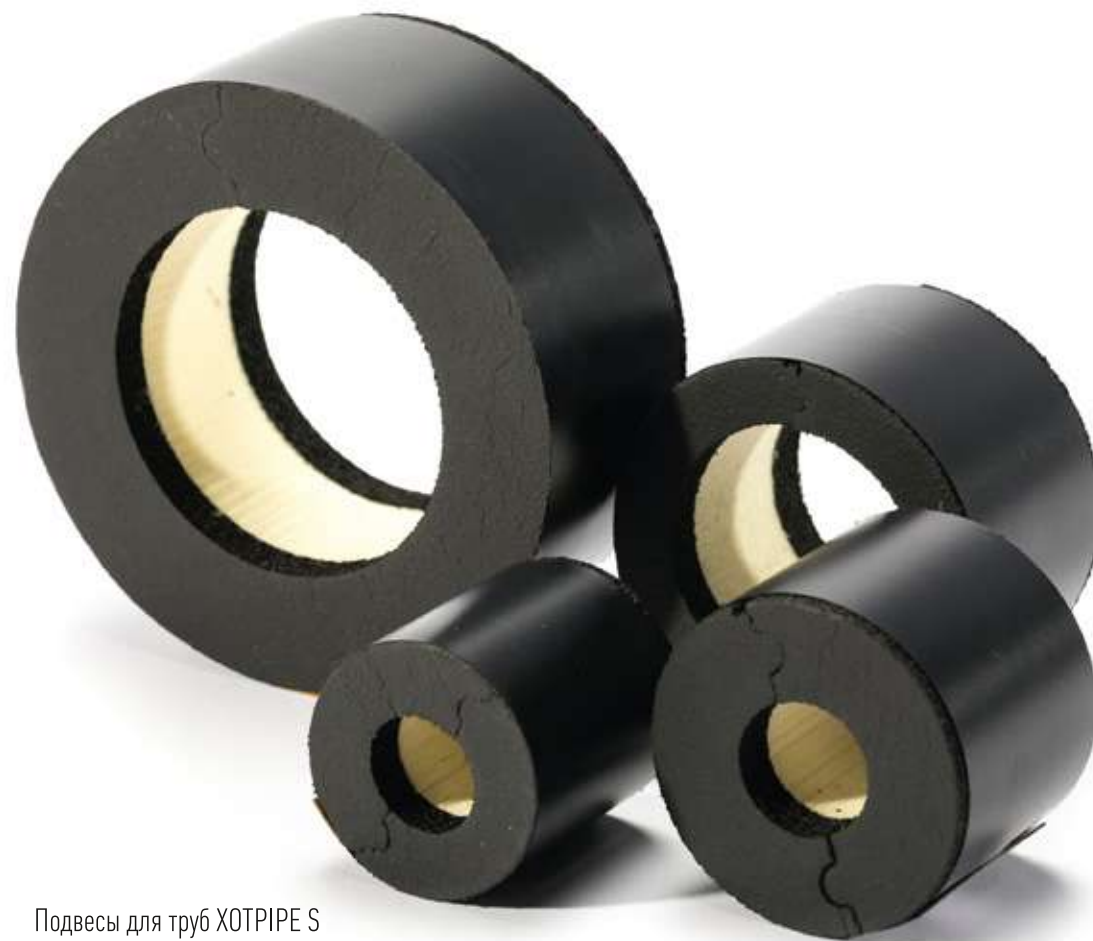
Подвесы для труб XOTPIPE S