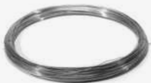
Проволока вязальная оцинкованная 1,2 мм