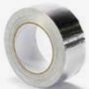
Скотч алюминиевый армированный 50 мм

В комплект поставки бесплатно включаются монтажные материалы и приспособления: