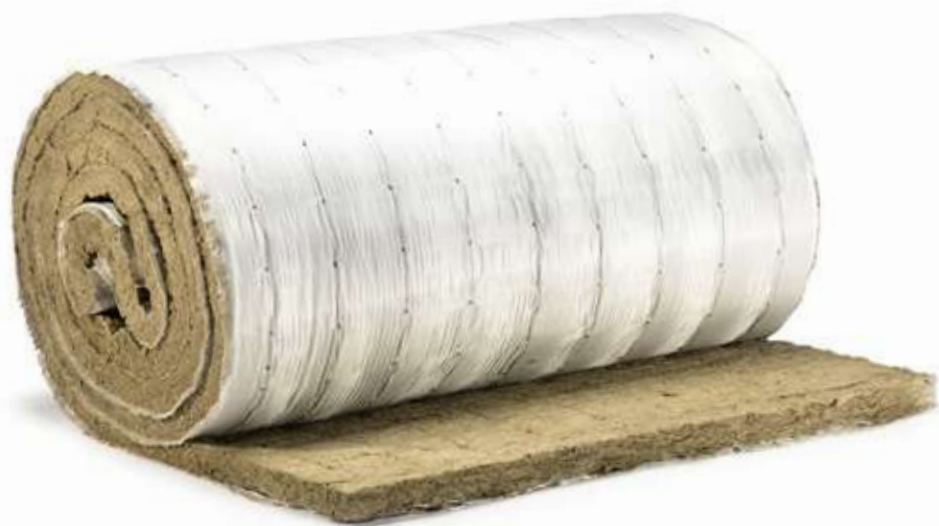
МП-100 ХОТРИПЕ МЕ-ТР ST ГОСТ 21880-2011 с покрытием стеклотканью