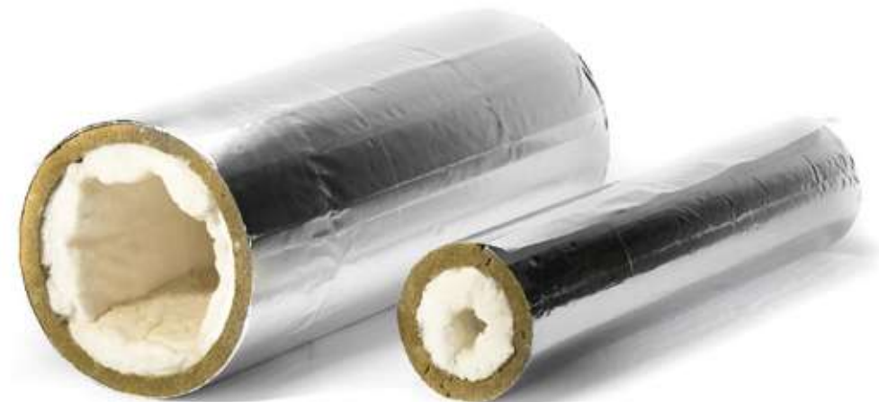
ХОТPIPE SP Combi Outside с защитным покрытием