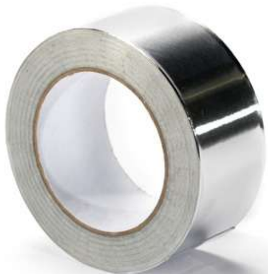
Скотч алюминиевый 50x50