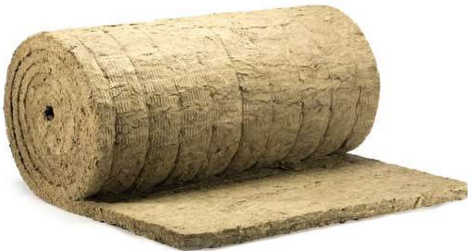
МП-100 ХОТРИПЕ МЕ-ТР ГОСТ 21880-2011 без покрытия