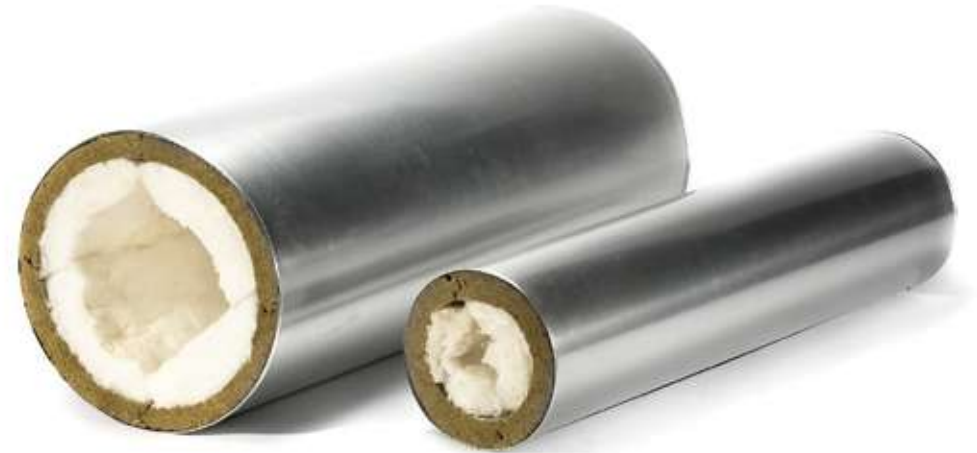
ХОТPIPE SP Combi ME в оцинкованной оболочке