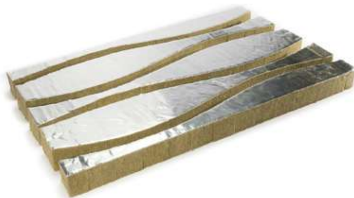
Отвод ХОТПАЙП ПР-СТ в развернутом виде