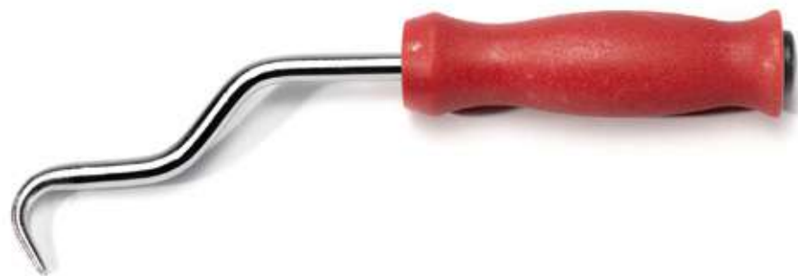
Крюк вязальный для металлической проволоки и сетки