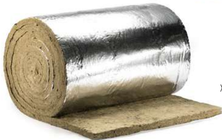
ХОТPIPE TR Alu 50 кашированный фольгой