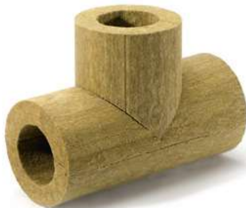
Тройник ХОТPIPE T