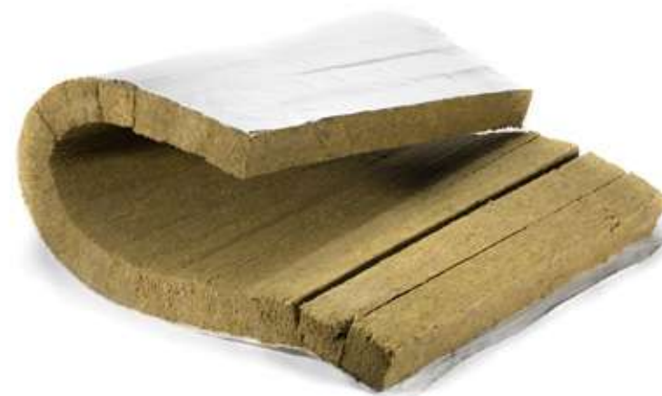
Прямой участок ХОТПАЙП ПР-СТ в развернутом виде