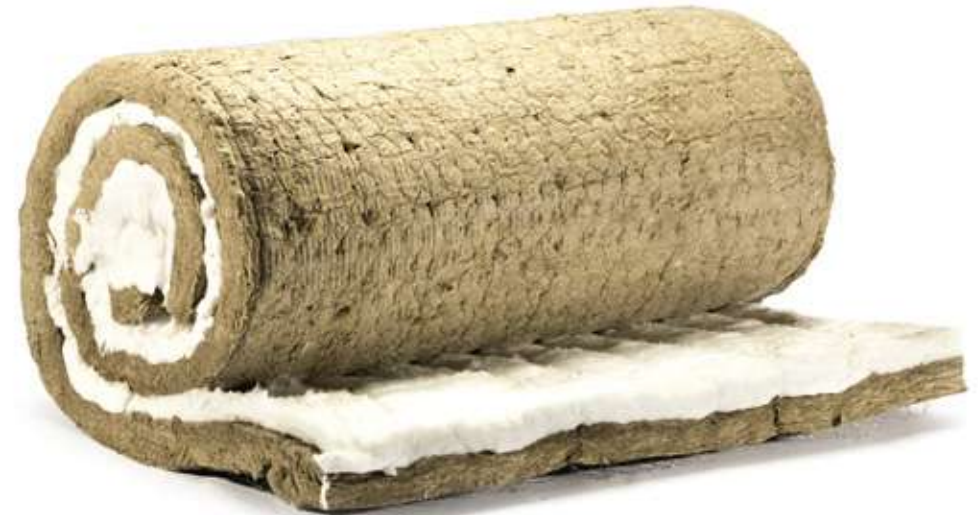
XOTPIPE WM-TR Combi с покрытием металлической сеткой