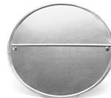
Заглушка ХОТPIPE O-ME C