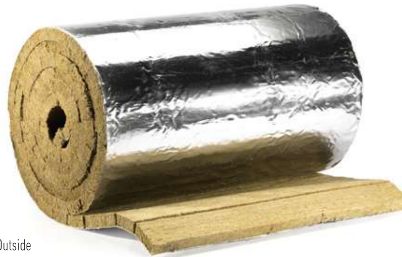
XOTPIPE LM Outside

Серийный выпуск по ТУ 5762-006-62815391-2016