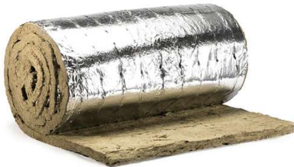
МП-100 ХОТРИПЕ МЕ-ТР Alu1 ГОСТ 21880-2011 фольгированный