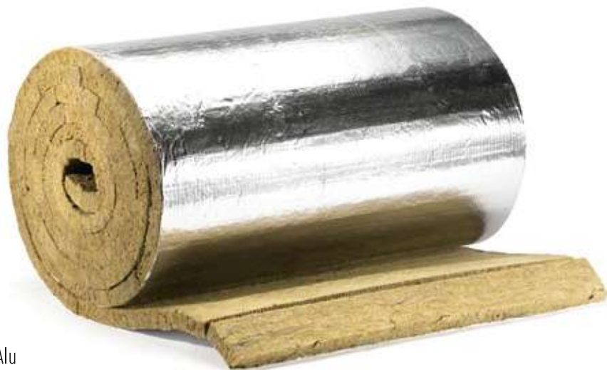
HOTPIPE LM Alu