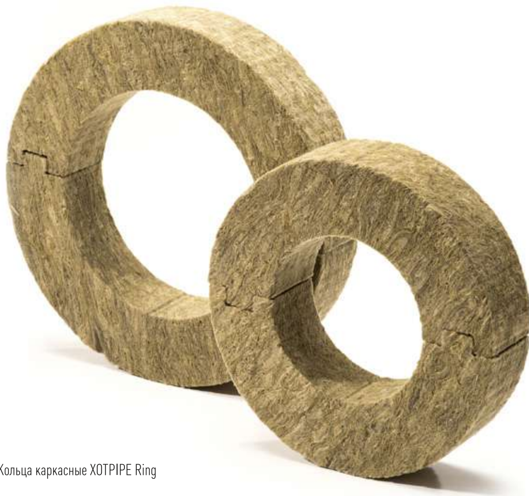
Кольца каркасные XOTPIPE Ring