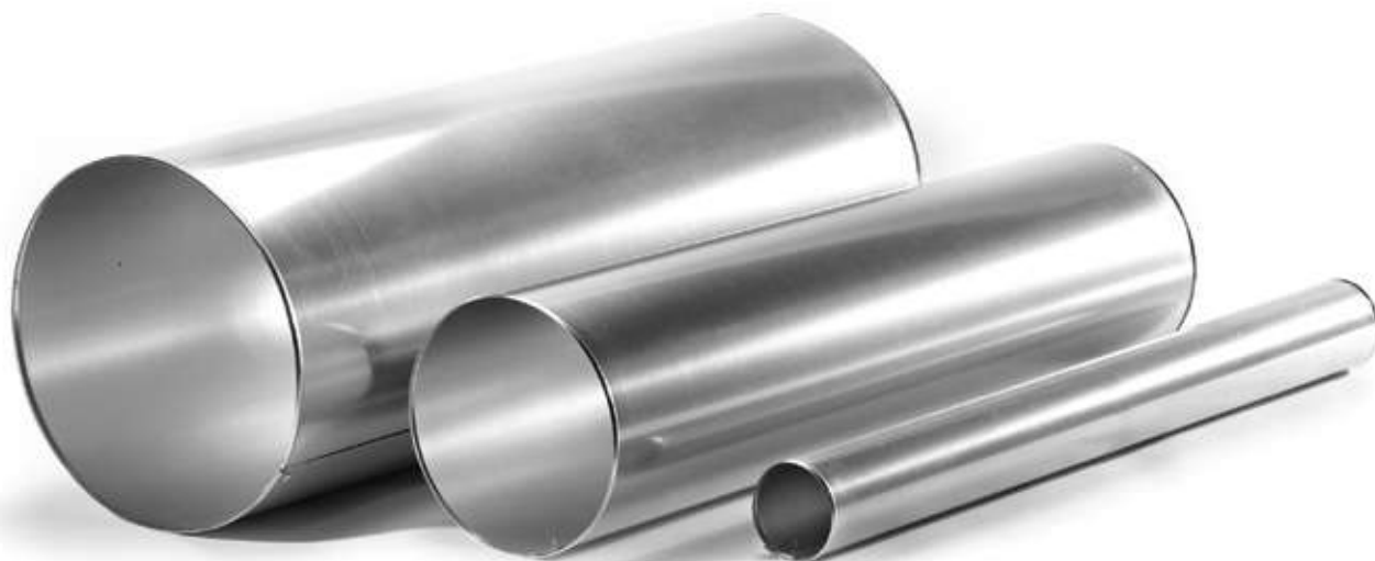
Прямые участки ХОТPIPE O-ME