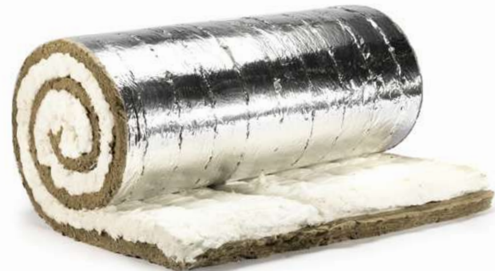
XOTPIPE ME-TR Combi Alu1 фольгированный