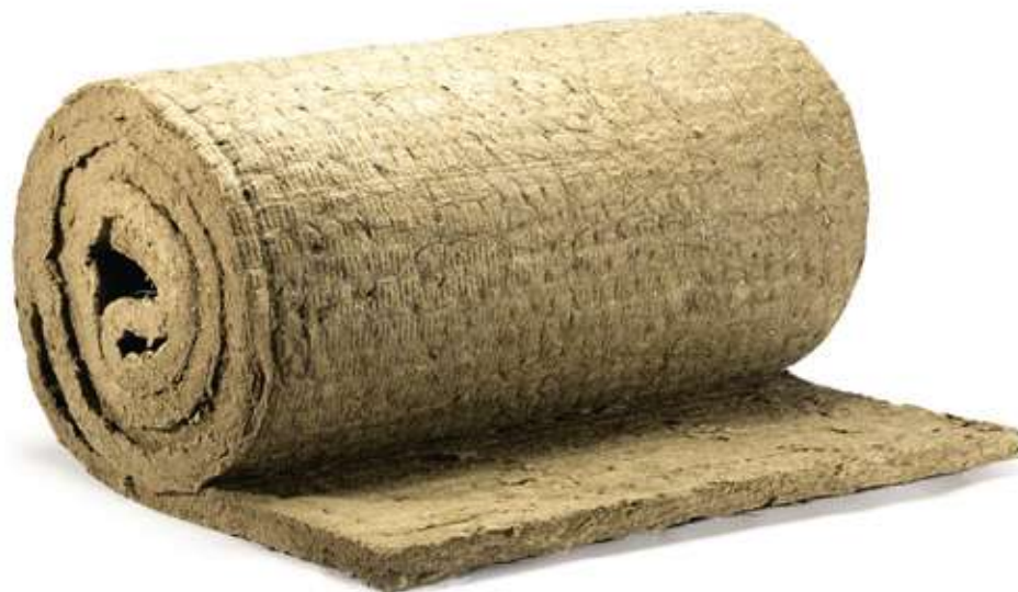
МП-100 ХОТРИПЕ WM-ТР ГОСТ 21880-2011 с покрытием металлической сеткой