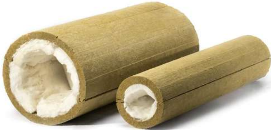
ХОТPIPE SP Combi без покрытия