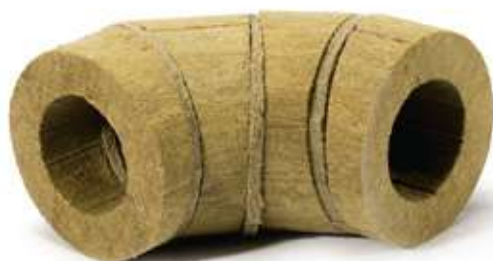
Отвод ХОТPIPE L