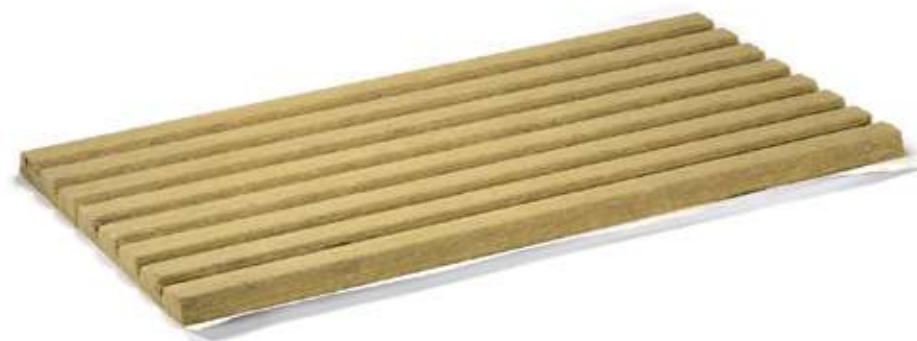
ХОТPIPE FP Outside 80 с защитным покрытием в развернутом виде