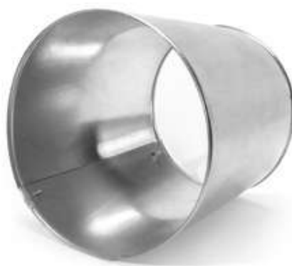
Переход ХОТPIPE O-ME P