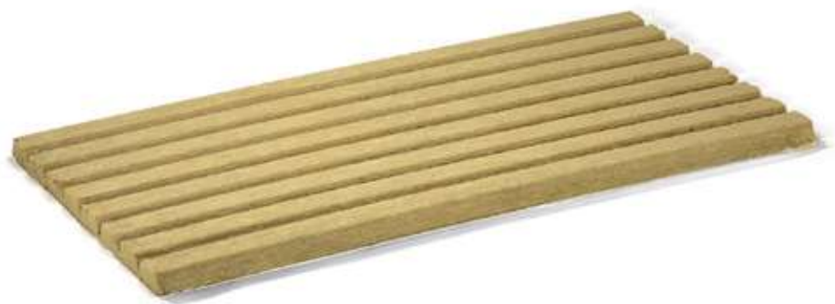
ХОТPIPE FP Alu 80 кашированный фольгой в развернутом виде