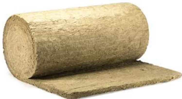
ХОТPIPE TR 50 без покрытия