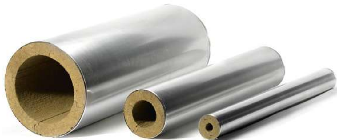
Прямые участки XOTPIPE SP ME

Серийный выпуск по ТУ 5762-006-62815391-2016 Соответствует требованиям ГОСТ 23208-2003