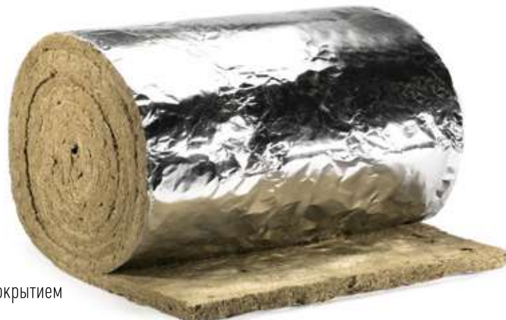
ХОТPIPE TR Outside 50 с защитным покрытием