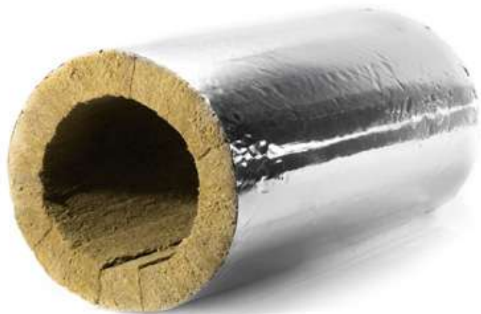
Прямой участок ХОТПАЙП ПР-СТ, свернутый в цилиндр