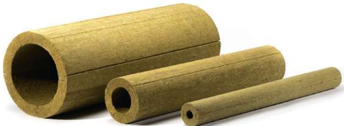
Прямые участки ХОТPIPE SP