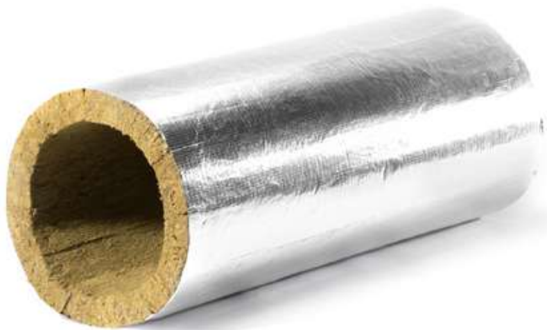
HOTPIPE SP-LM Alu 50, свернутый в цилиндр