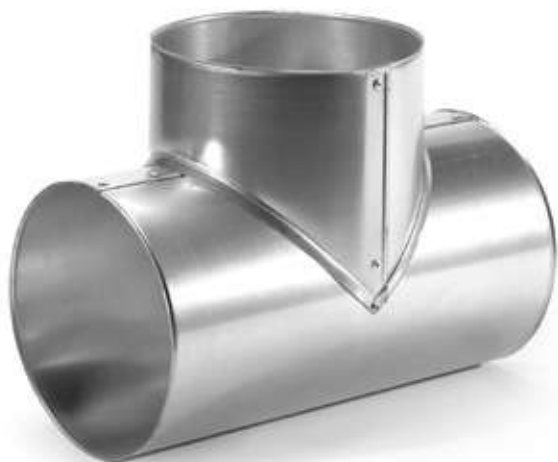
Тройник ХОТPIPE O-ME T