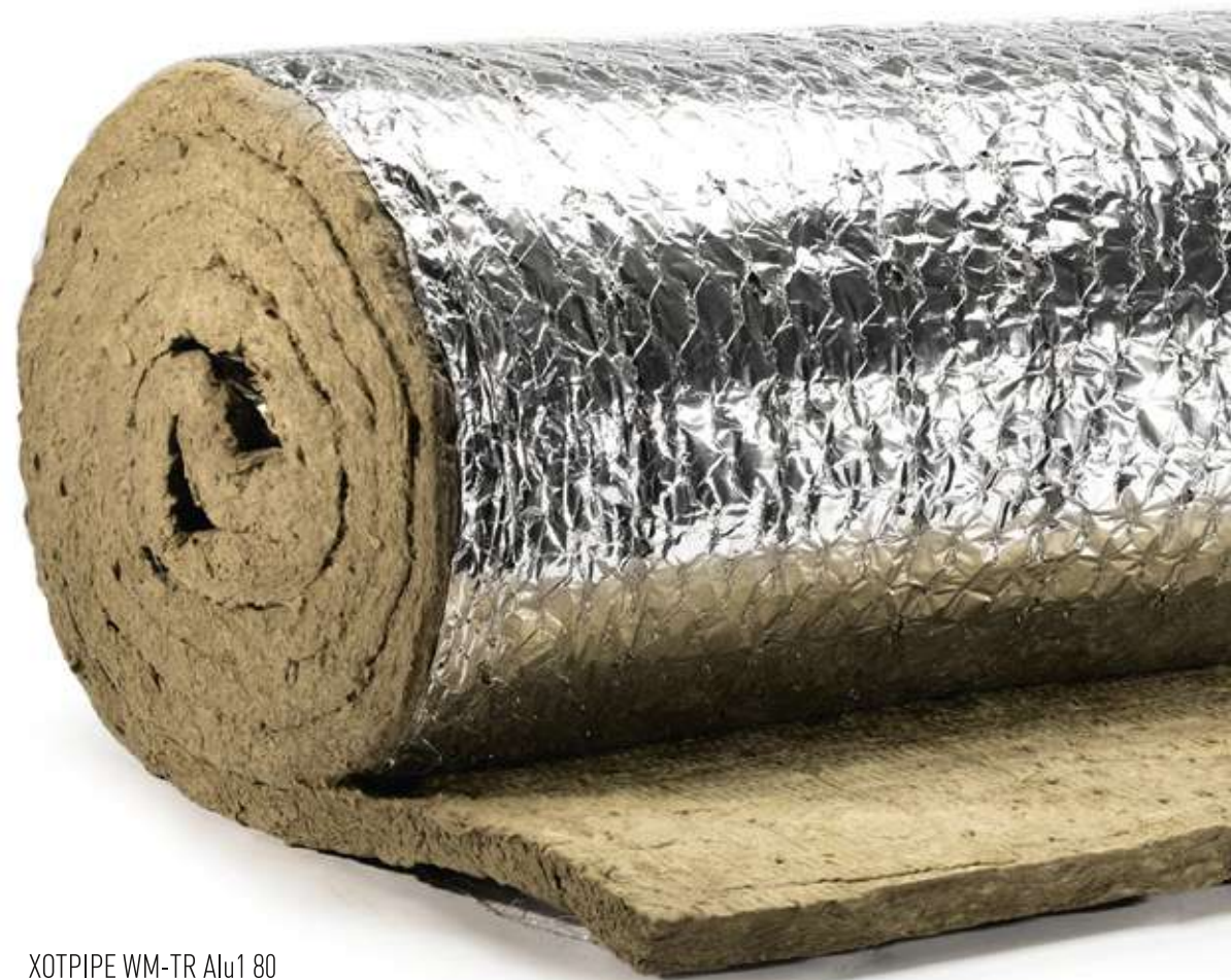
ХОТPIPE WM-TR Alu1 80