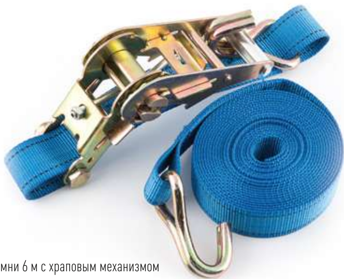
Стяжные ремни 6 м с храповым механизмом