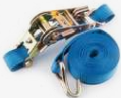
Стяжные ремни с храповым механизмом